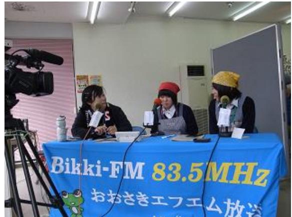
今年もラジオ出演！