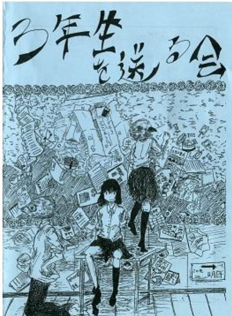
今年も芸術的なパンフレットです

2月27日(月)、本校体育館で3年生を送る会が開かれました。3年生の入場後、吹奏楽部による意気ぴったりの迫力ある演奏、部活動の後輩たちからのメッセージ、昨年まで中新田高校に勤めていた先生方からのビデオレターなど、内容盛りだくさんの思い出に残る会となりました。後輩たちや先生方からの熱いメッセージに3年生は感動し、歓声をあげていました。また、最後の3年生からのメッセージではクラス独自の色を出して、後輩への激励と先生方への感謝の思いを伝えていました。生徒、教員ともに涙あり笑いあいの2時間を過ごす事ができました。