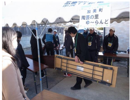
朝早くからの準備、お疲れさま！