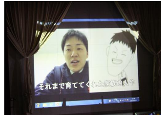
恩師からのメッセージ