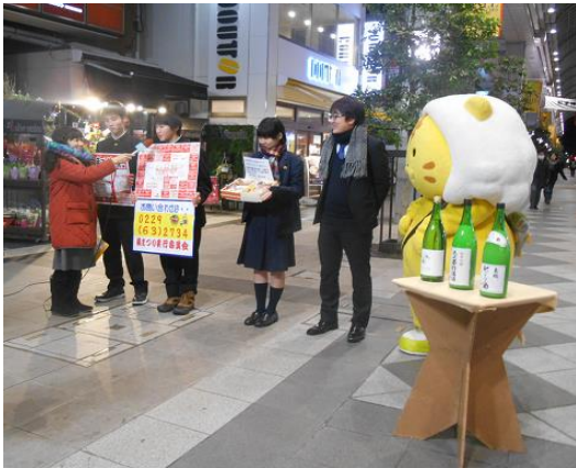
中高代表の3人がOH!バンドスに出演

2月11日（土）、加美商工会（鍋まつり実行委員会）主催の第17回うめえがすと鍋まつり in 加美が開催されました。代表生徒が2月2日（木）にOH!バンドスに出演し、PR活動をしたこともあり、鍋まつり当日は多くの人で賑わいました。生徒たちはお菓子の販売、高校生カフェ、鍋作りと販売、ゴミの分別、観光客の案内などに分かれ、大いに地域に貢献しました。なんと「お菓子のオーケストラ」は、120箱をたった34分で完売しました。また、地元の食材を使った中新田高校生の鍋「ほのぼのかみーご お助けなべ」も並んで買う人が多く、大好評でした。当日は生徒会執行部だけでなく、ボランティア委員、野球部など多くの生徒たちが協力してくれました。中高生、来年もがんばります！