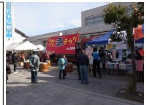
鍋まつり in 2017