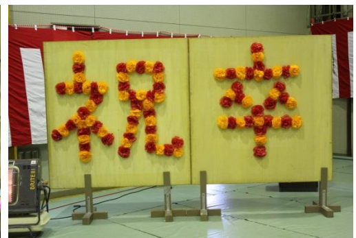
1, 2年生が心を込めて作った飾り