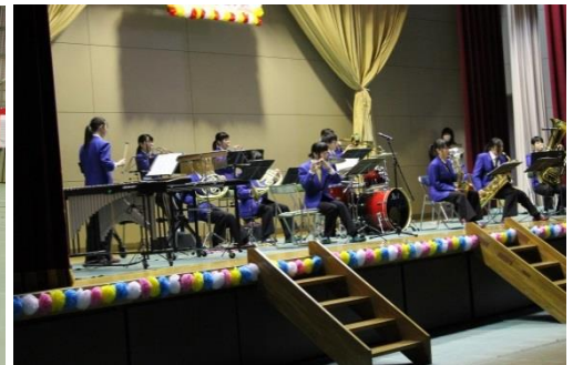
吹奏楽部による演奏