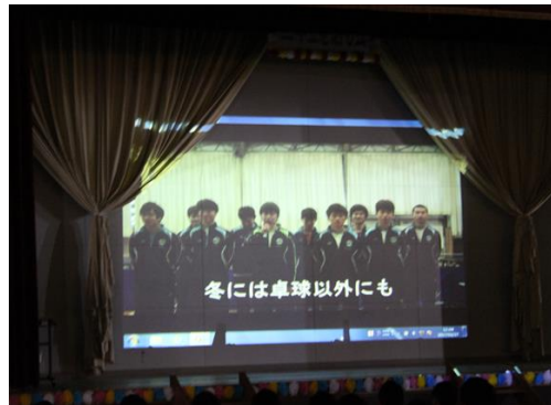
後輩からのメッセージ